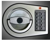
El. Schloss M-Locks