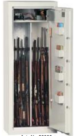
Art.-Nr. 56000 + Art.-Nr. 56026 + 4x Art.-Nr. 56028