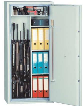
Art.57201 in Mehrweckausf. mit Art.-Nr. 57223+57224 Trennwand und 3 Fachböden