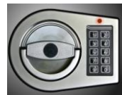
Ei. Schloss M-Locks